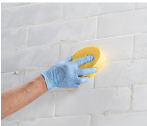
Pulizia e finitura delle fughe con spugna di cellulosa dura