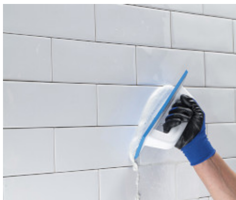
Stesura di Keracolor SF con spatola MAPEI